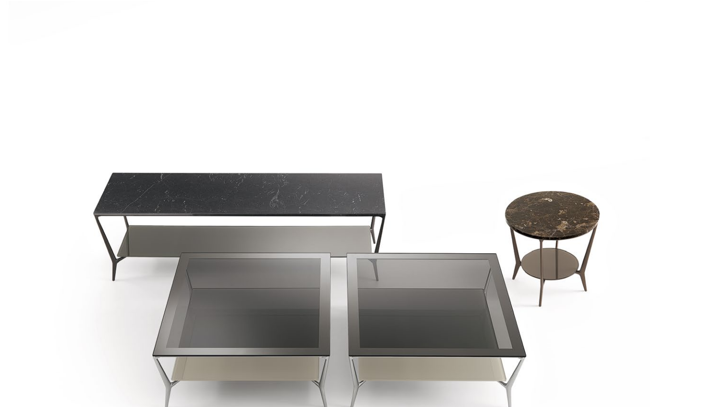
Tavolino quadrato Square table Strutture Structure : 31 alluminio lucido Top Top : 63 grigio trasparente Sottopiano Lower top : 85 tufo lucido W 600 H 360 D 600