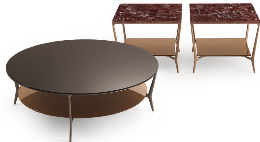
Tavolino tondo Round table Struttura Structure : 303 bronzo Top Top : 84 moro lucido Sottopiano Lower top : 300 rame lucido Ø 1100 H 360