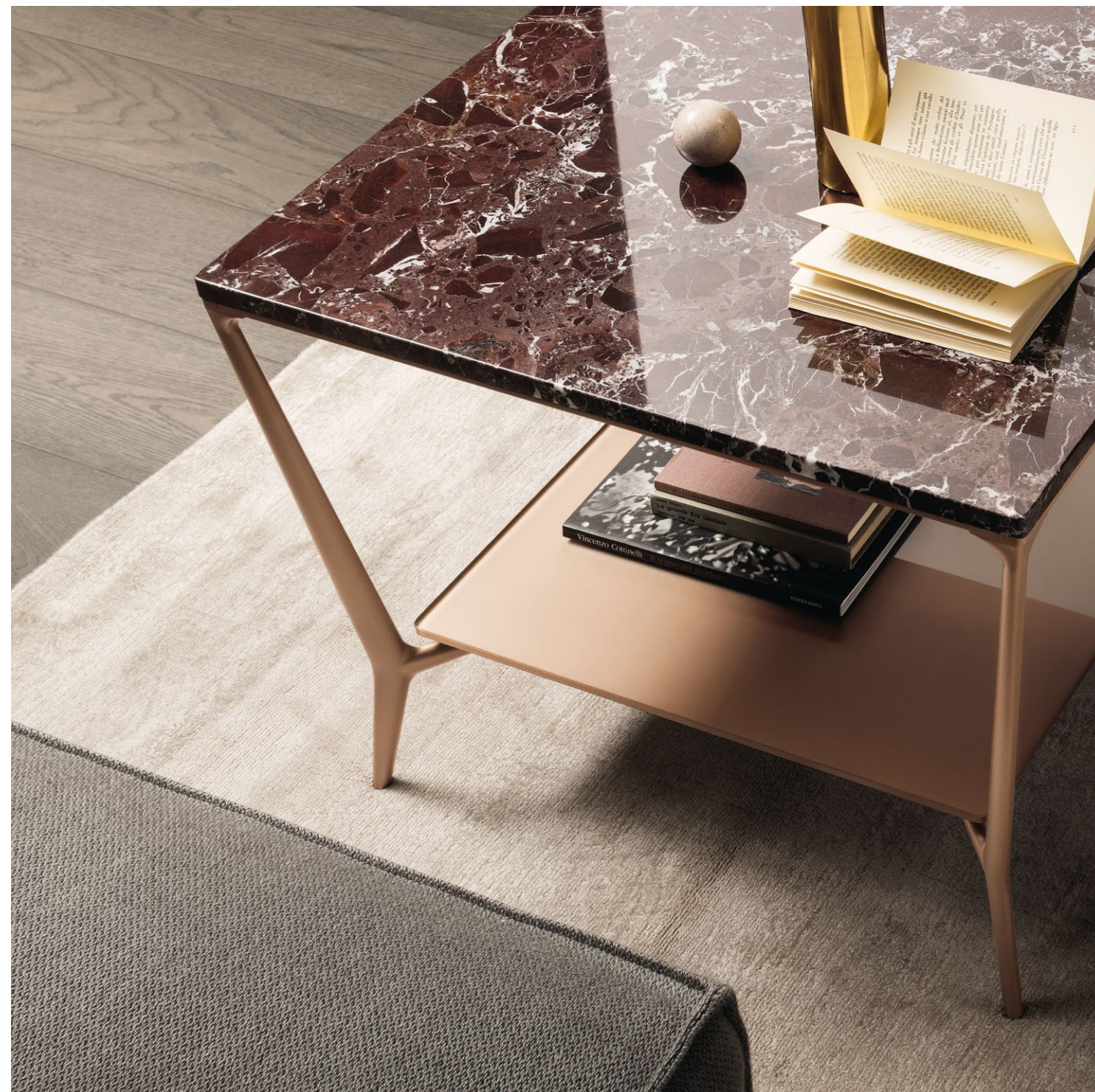
Struttura Structure : 300 rame Top in marmo Marble top : 182 rosso lepanto Sottopiano Lower top : 300 rame lucido W 600 H 480 D 600