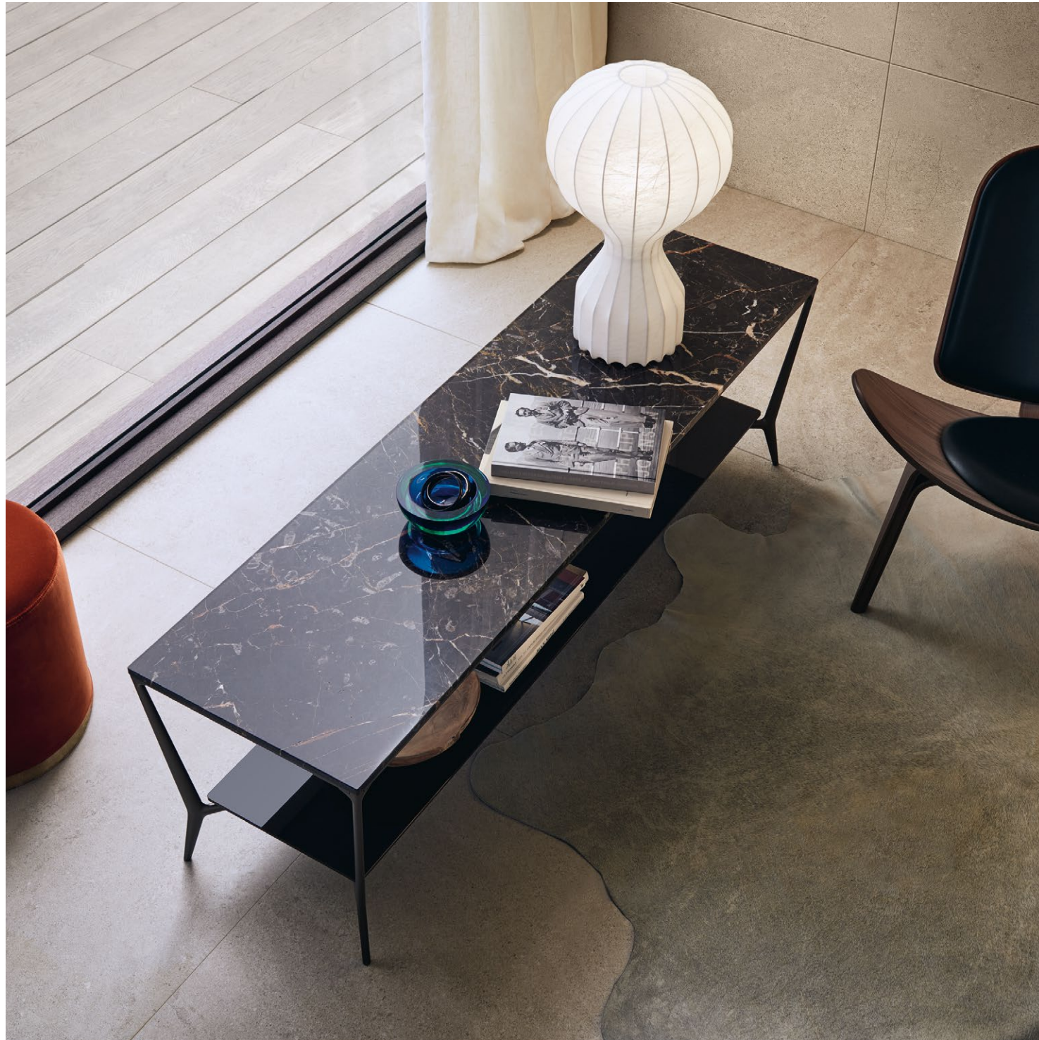
Struttura Structure : 303 bronzo Top in marmo Marble top : 183 noir Saint Laurent Sottopiano Lower top : 84 moro lucido W 1600 H 480 D 450