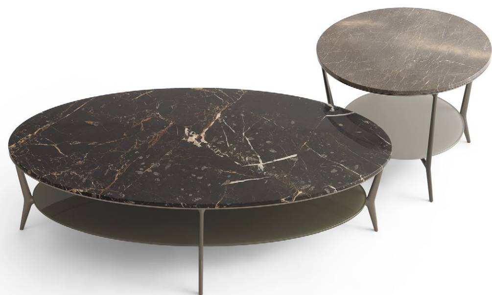
Tavolino ovale Oval table Struttura Structure : 303 bronzo Top in marmo Marble top : 183 noir saint laurent Sottopiano Lower top : 57 tortora lucido W 1300 H 360 P 650