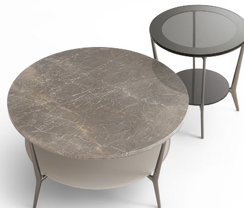
Tavolino tondo Round table Ø 800 Struttura Structure : 18 nickel nero Top in marmo Marble top : 184 crystal grey Sottopiano Lower top : 130 tufo opaco Ø 800 H 360